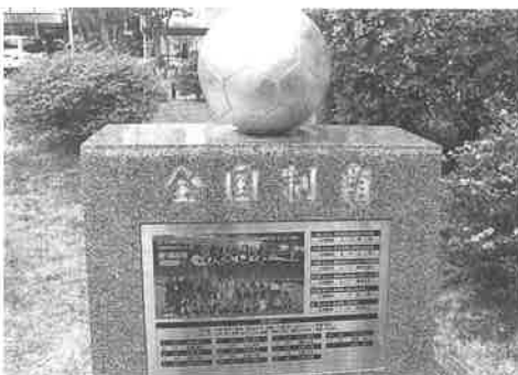
サッカー全国制覇

で撮影許可を得た際、受付の女性から「この本館の建物も本年度まで建て替えとなります。記念に写真に残してください」と笑顔の説明を受けた。運動場はあまり変わっていないが、校舎は全体的に変容しており、当時の面影は全く見られなかった。とはいえ、背広姿でネクタイ着用の男女生徒達が出会う度に「今日は。今日は」と挨拶してくれたのは、気持ち良かった。校内には平成一八年のサッカー全国制覇その他の記念碑が設置されていた。昼飯の休憩のみで朝九時頃から夕方四時頃までに強行した「ふるさとを撮る——広島の変容——」は、名残惜しげに終了した。