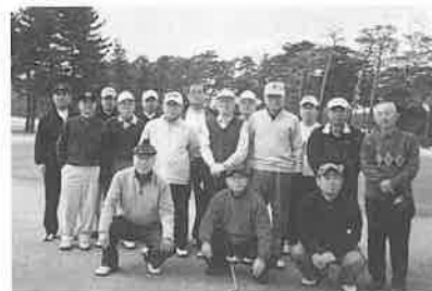
霞ヶ関カントリー