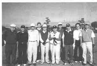
川越グリーンクロスCC