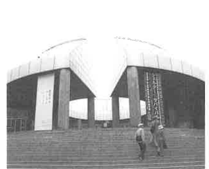
広島市現代美術館