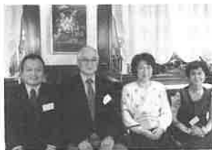
観音4回生(左端2,3回生)